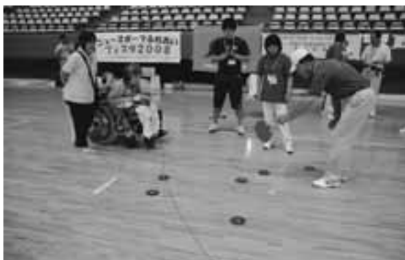
(昨年の大会模様：協力＝静岡県ディスコン協会)